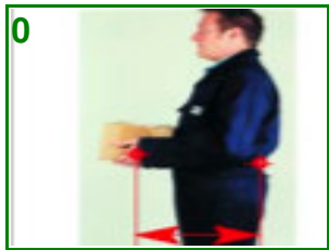
Bovenarmen verticaal Romp rechtop