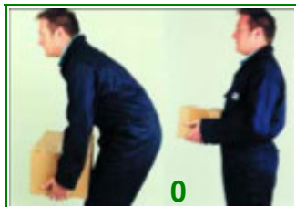
Tussen knieën en ellebogen