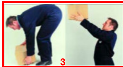
Op de grond of Boven het hoofd