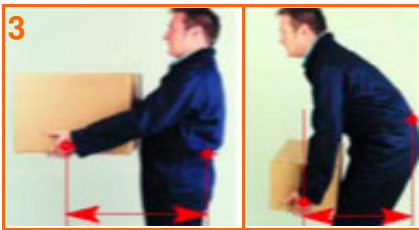
Bovenarmen reiken OF Romp gebogen