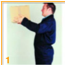
Hoger dan ellebogen