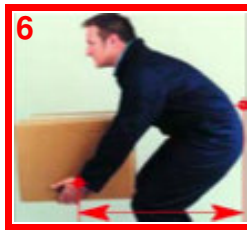
Bovenarmen reiken EN Romp gebogen